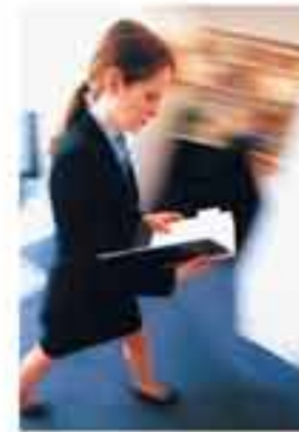
>Lorem ipsum Dolor Sit Amet

Lorem ipsum dolor sit amet, consectetur adipiscing, sed diam nonummy nibh euismod tincidunt ut laoreet dolore magna aliquam erat volutpat. Lorem ipsum dolor sit amet, consectetur adipiscing, sed diam nonummy nibh euismod tincidunt ut laoreet dolore quis nostrud exerci tation ullam.