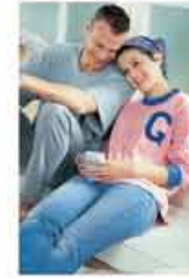
>Lorem ipsum Dolor Sit Amet

2 Lorem ipsum dolor sit amet, consectetur adipiscing, sed diam nonummy nibh euismod tincidunt ut laoreet dolore magna aliquam erat volutpat. Ut wisi enim ad erat minim veniam, quis nostrud exerci tation ullamcorper. Ut wisi enim ad erat minim veniam.